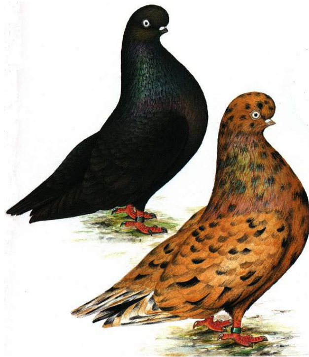
Culbutant Anglais à Courte Face

*** Les opinions émises dans ces articles n'engagent que la responsabilité de leurs auteurs***