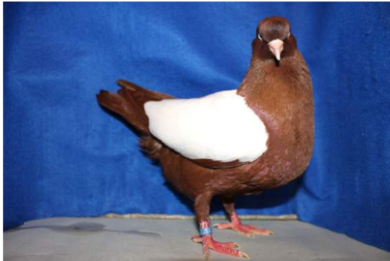
Champion toutes races: Hervé Morin, Haut-volant Neerlandais Cage 1453 97 pts.