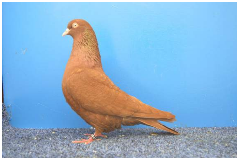
Champion races française : Hervé Vennin, Culbutant Français rouge Cage 1284 97 pts.